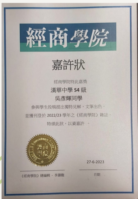
學生成功投稿並獲證書

中五級企財科與旅遊與款待科合作，於 2023 年 5 月舉辦主題餐廳設計匯報會，透過專題研習匯報及董事局會議提問活動，以提高學生跨科學習思考能力、及應用知識能力。此外，學生亦參加了不同比賽，例如香港會計師公會主辦的商業個案比賽，有助他們研習能力。