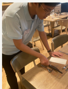
學生於酒店進行工作體驗