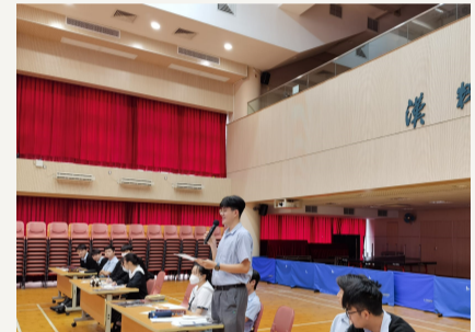
學生於模擬董事局會議認真提問