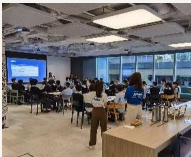
學生參觀會計師事務所