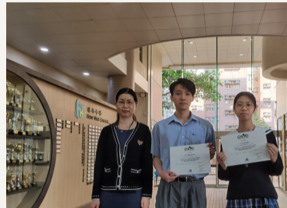
學生完成商業課程精英學習計劃並獲證書