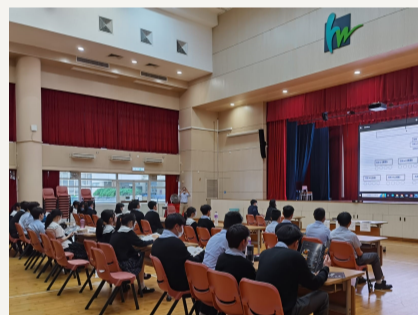
學生於模擬董事局會議表現投入